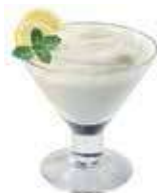
sorbetto al limone